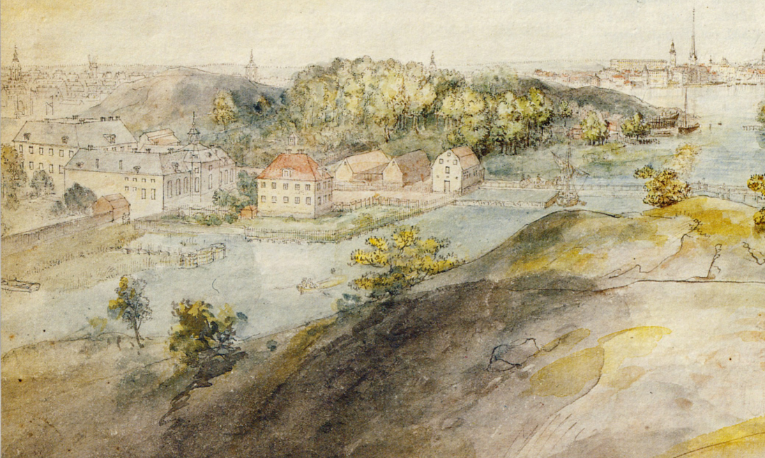
Utblick över Långholmen och spinnhuset från Södra malmen av Elias Martin, 1787.