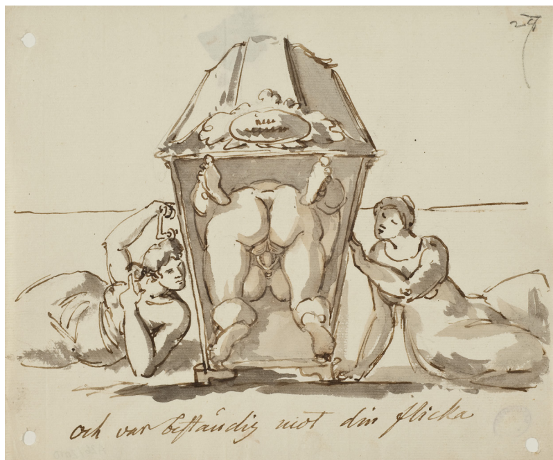
»Och var beständig mot din flicka» lyder texten längst ner på Carl August Ehrensvärds burleska bild av en likkista i genomskränning. Död, kärlek och köttsliga begär är ett återkommande tema i 1700-talets kultur.

sin oskuld – hon dog som mö och stod upp som mamsell. I Bellmans skaldekonst används liknelsen mellan samlaget och döden flitigt. Men sorgeskvadets form i hordikterna understryker också den kontrastverkan som versernas innehåll förmedlar. Det är ett stilgrepp som även det känns igen från andra källor – inte minst från Fredmans epistlar . De tvära kasten, de burleska mötena mellan högt och lågt, högstämt och oanständigt tycks omfatta en för seklet typisk humor. Företeelser som utger sig för att vara en sak men är en helt annan kan också relateras till 1700-talets vurm för det sceniska och teatrala – och mellan teatern och synden fanns flera förbindelser.