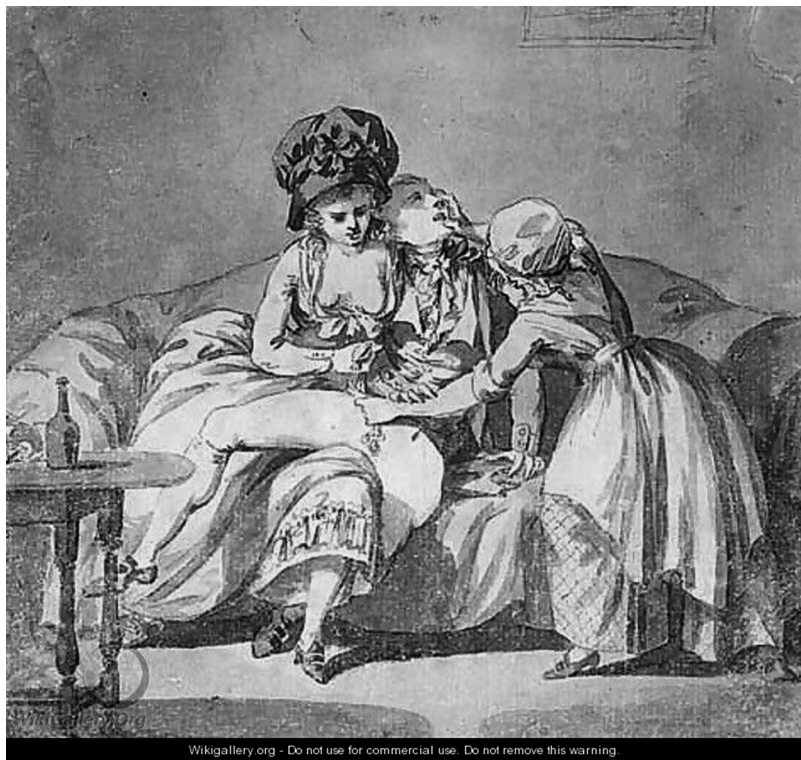
»Thieving from a gentleman» av Elias Martin visar två kvinnor som vittjar fickorna på en utslagen man. Återkommande stereotypa representationer av kvinnan i prostitution är penninglystnad och tjuwaktighet.

betecknar opålitlighet, lättja och lättsinne. Andra tillskrivna drag varierar, och reflekterar antiteser till vad samtiden värdesätter eller betraktar som heligt. Om 1700-talet betecknade horan som ogudaktig, liderlig och lat, karakteriserades hon under 1800-talet snarare som mentalt eller psykiskt defekt, okvinnlig och girig. Medan horan under 1700-talet kunde vara vilken kvinna som helst som saknade moral, representerade hon under 1800-talet i hög grad den Andra. Medan 1700-talets krognympfer bröt mot en av Gud påbjuden lag,