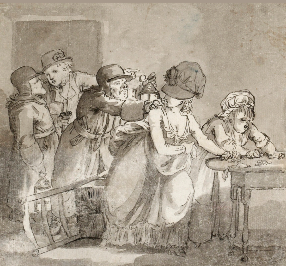
»Tillslage» av Elias Martin från okänt årtal visar hur paltar stövlar in i ett hus och griper »lösa kvinnor» i färd med att räkna förfjänsten. Lyktor i männens händer tyder på att det är natt, och den omkullvräkt stol visar på det tumultartade gripanet.