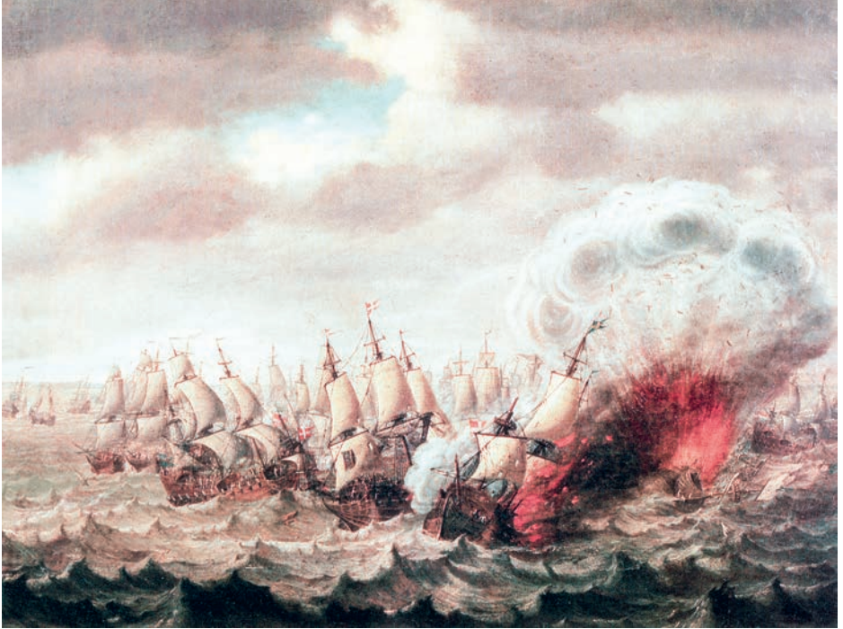
Fig. 2.5. Johan Tietrich Schoultz målade denna tavla av slaget vid Öland redan under 1770-talet. Efter Brorsson 2004:170–171.

tans män, såsom skeppet Ölands strid mot engelsmännen 1704 samt sjöslaget vid Femern 1644 (jfr Unger 1932:1–16).