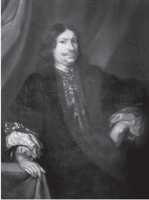
Fig. 2.1. Friherren Lorentz Creutz verkade som lagman, landshövding, riksråd, kamrarråd och vice bergskollegiepresident. Under skånska kriget blev han utsedd till flottans högsta befäl. Målning av David Klöcker Ehrenstrahl.