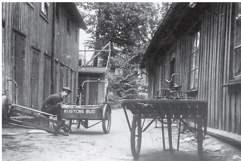
Bild 6.1. Cykelbud anställd vid Kustens Bud underhåller sin cykel på Karl Johansgatan i Majornas 2:a rote.

Bland dem som flyttat hemifrån var det betydligt fler som hade en yrkestitel i mantalslängden än som betecknades som studerande: 83 procent av männen och 92 procent av kvinnorna. Bland dem som bodde hemma hade 65 respektive 49 procent en yrkestitel. Det var också fler i den manliga gruppen som hade en taxeringsbar inkomst, och deras genomsnittliga inkomst var högre (se tabell 6.5).