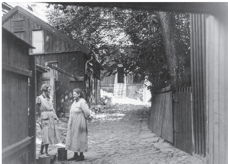
Bild 1.2. Två kvinnor hämtar vatten vid en kommunal kran i Majornas 3:e rote 1940.

av de inkomster som familjen behövde för sin försörjning. Kvinnan förväntades ta huvudansvaret för det obetalda reproduktiva arbetet i hemmet. För kvinnan var deltagandet i förvärsarbete koncentrerat till en kort period före familjebildningen och eventuellt en period efter det att barnen lämnat hemmet.