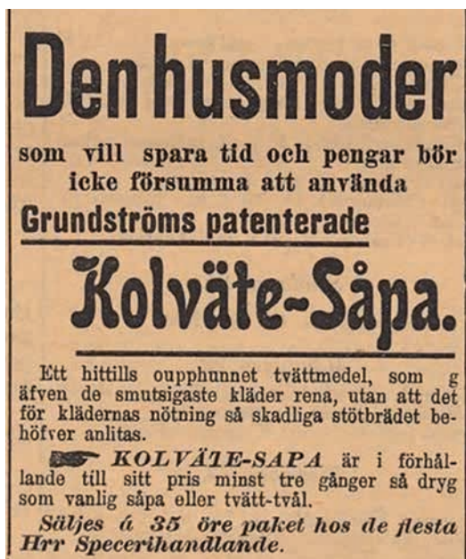
Bild 4.3. Annonns för såpa som riktar sig till den som förväntas använda den – husmodern.

kamin, användandet av köket som ett gemensamt sovrum samt bruket att sova i ladugården. Från Hede i början av 1880-talet noterades till exempel: "Öfverbefolkning förekommer icke säges det. I samma rum kan emellertid bo ända till 8 à 10 personer största delen af året. Oeldade sofrum äro sällsynta. Om under Vintern veden tryter, inflyttas bostaden i fähuset." 75 Annelie Drakman, som studerat provinsialläkarnas praktiker under 1800-talet, har också funnit många exempel på trångboddhet och att allmogen kunde dela hus med få och boskap långt in på 1890-talet. 76 Vattnets beskaffenhet och hanteringen av livsmedel var ytterligare två angelägna ämnen.