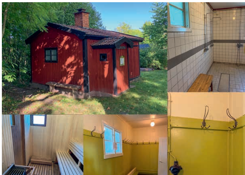
Bild 1.3. Bildkollage från Blidö Badhusförenings badstuga som är byggd efter Föreningen för Folkbads typritning Småland II. Badstugan byggdes 1945 och är ännu i bruk. Fotona är tagna i samband med renovering av basturummet i september 2020.

Även i Norge kom det att byggas badstugor i liten skala. Året efter bildandet av den Svenska Föreningen för Folkbad bildades Norges Badeforbund. Förbundet bildades genom att flera olika organisationer gick samman och huvuduppgiften var att samla in badstatistik samt verka för ökat folkbad. Föreningen samordnade ekonomiska och tekniska frågor och bistod med expertis och tekniska lösningar. Förbundets verksamhet finansierades från 1925 och framåt genom penninglotteriets lotterimedel ”for folkebad på landsbygda”. År 1927 beviljades det första norska statsbidraget för folkbad. 101