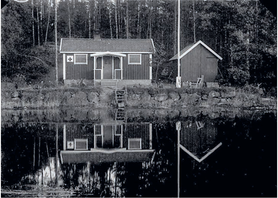
Bild 1.1. Under 1900-talets första hälft byggdes folkbad i form av små badstugor på den svenska landsbygden. Badstugorna bestod oftast av ett omklädningsrum och en bastu. Fotot föreställer Röda korsets badstuga i Södra Ving vid vattnet i Tolkabro i Västergötland under 1950-talet.

erbjuda möjligheten att sköta den personliga hygien i badinrättningar såsom skolbad och bastubad. 3