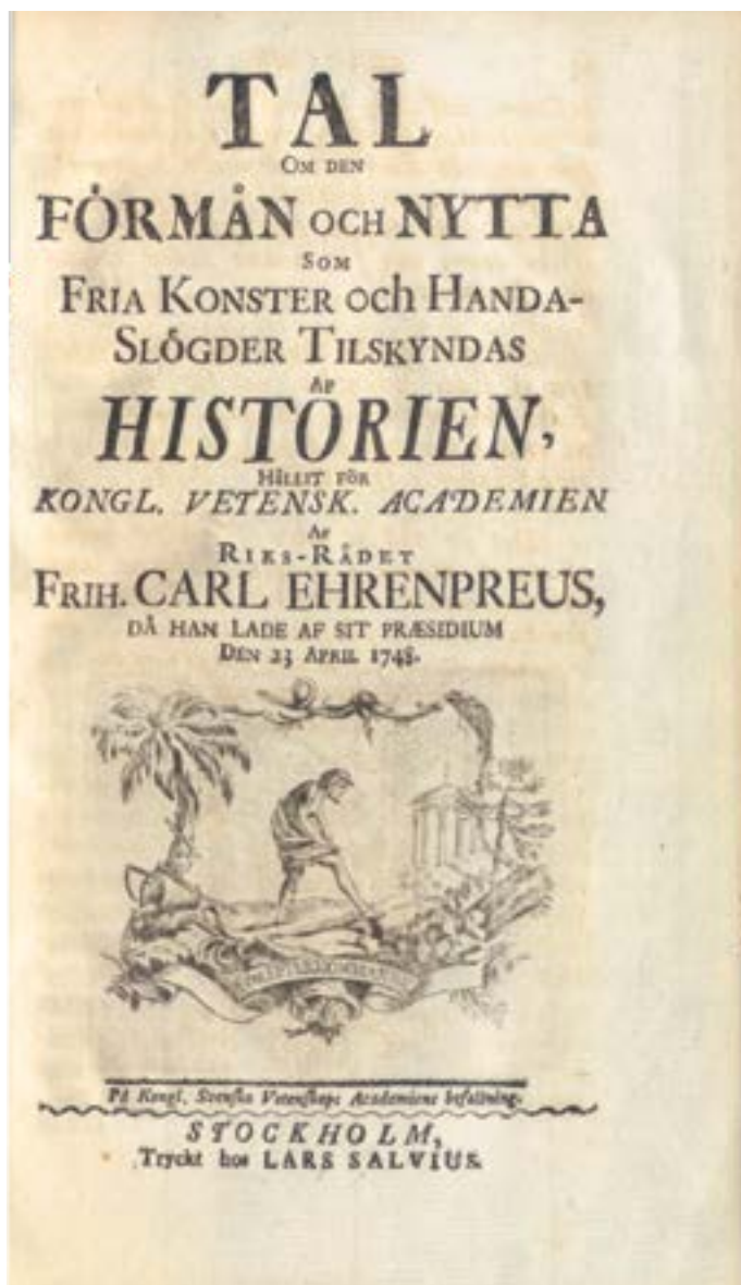
Bild 13. Titelsida till Carl Didrik Ehrenpreus Tal om den förmån och nytta som fria konster och handaslögder tilskyndas af historien (1748).