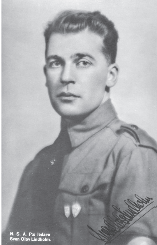
Bild 10. Sven Olov Lindholm som partiledare för NSAP, signerat porträtt.