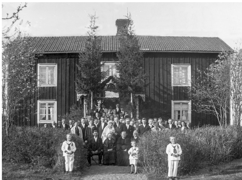
Arv och äktenskap var nära förknippade med varandra. Giftermål symboliserade starten på något nytt och ett hopp för gårdens framtid. Bröllop i Tuna socken, Småland, 1928.

och industriorter. 334 Det var främst yngre personer som flyttade och efter hand blev det allt tydligare att det främst var kvinnor som lämnade landsbygden. 335 På 1930-talet uppmärksammade den statliga Befolkningskommissionen den sneda könsfördelningen och underströk att den fick allvarliga konsekvenser för äktenskapsbildningen på landsbygden eftersom det ”för en ogift man, som önskar gifta sig, måste vara jämförelsevis svårt att på landsbygden finna en kontrahent inom åldersgrupperna 20–35 år”. 336