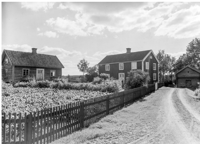
Om den äldre generationen drog sig tillbaka och höll sig med eget hushåll kunde de bo på övervåningen i boningshuset eller i ett separat bostadshus. Gårdsbebyggelse i Valåkra by i Högsby socken, Kalmar län. Mangårdsbyggnad i bildens mitt och undantagsstuga till vänster.

att göra med den ökade närvaron av vuxna barn. Enkäterna ger inga svar om hur vanligt det var att föräldrar ingick i sterbhusen, men här går att föra ett tentativt resonemang. En effekt av att föräldrarna inte lät ett relativt ungt barn ta över utan behöll både egendomen och ansvaret var att den ursprungliga familjekonstellationen inte splittrades genom en markerad och tydligt tidfäst generationsväxling. Visserligen kan gården informellt ha övertagits av ett av barnen, men det är sannolikt att hushållets strukturella stabilitet försvårade uppbrott och främjade kontinuitet. Många syskonjordbruk bör ha etablerats medan åtminstone en av föräldrarna ännu var i livet. Det riktar fokus mot hur relationerna mellan generationerna såg ut.