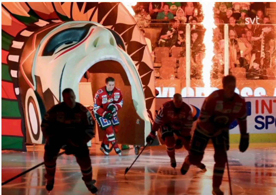
Frölundaspelare gör entré via ett indianhuvud.

Grahamsdaughter gör entré med Stockholmståget. Därmed etableras en rad motsatts-förhållanden: Huvudstaden mot andrastaden, kvinna mot man, resenären (från Stockholm, men också från Nordamerika) mot lokalprofilen, glädjeförstöraren mot den goa gubben, konstnären mot sportsupportern med flera.