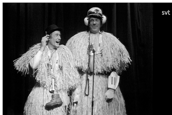
Dagens Nyheter 13 juli 1969. Till höger Tage Danielsson och Hasse Alfredson i "88-öresrevyn" 1970 (över) och Gösta Ekman och Tage Danielsson i revyn "Glaset i örat" 1973 (under).