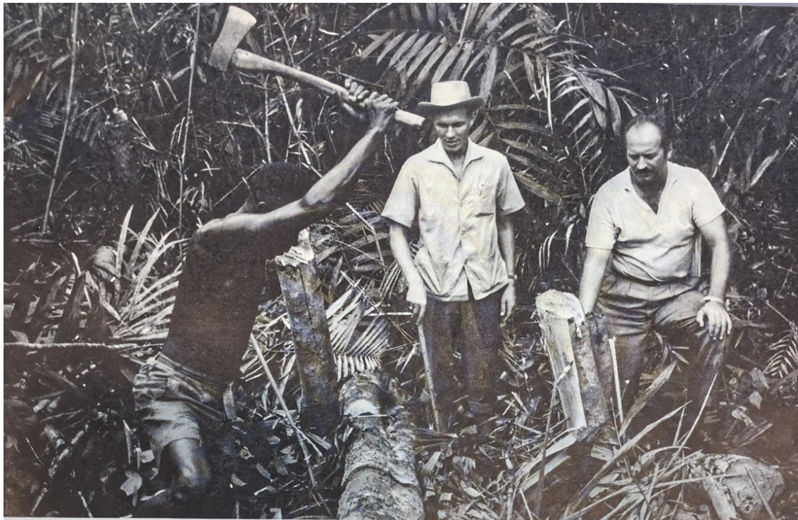
* Två svenska ingenjörer övervakar utdikningen av ett träsk- och djungelområde vid Stanley Pool i Congo.

Som Eriksson Baaz påpekar ligger konflikten inbyggd i själva utvecklingsbegreppet: å ena sidan "utveckling" som en konkret praktik där teknik, projekt och pengar kan förändra, å andra sidan utveckling som en "immanent process", en evolution där människan tar sig från ett trappsteg till nästa och den ene är "före" och den andra "efter" (Eriksson Baaz 2002, s. 208–209). Båda dessa förståelser av "utveckling" mötte hos biståndsarbetarna, på sent 1990-tal liksom vid tidigt 1970-tal.