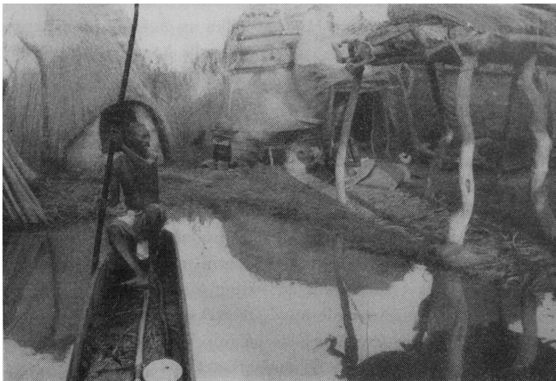
I vissa delar av världen, som i Ekvatorialafrika, lever befolkningen fortfarande under mycket primitiva förhållanden.