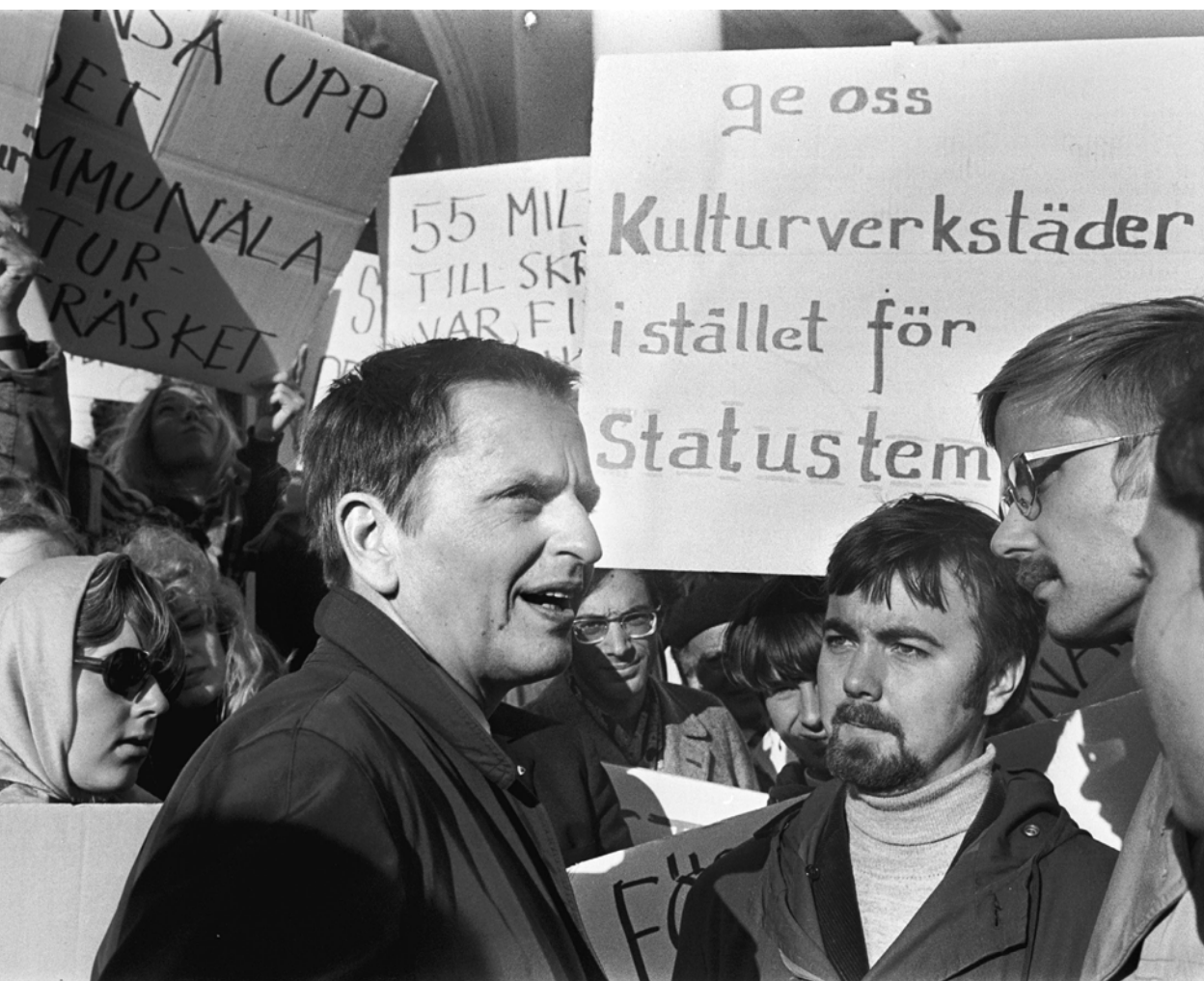
● OLOF PALME VAR EN VÄN AV FOLKBILDNING. Före sin tid som partiledare och statsminister satt han i ABF:s styrelse under flera år. Här diskuterar han med kulturivrande demonstranter i Göteborg i september 1969.