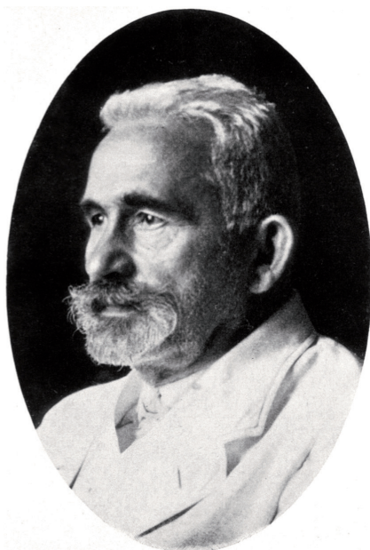
Emil Kraepelin (1856–1926) är mest känd för sin uppdelning mellan dementia praecox (senare mera schizofreni ) och manodepressiv psykos .