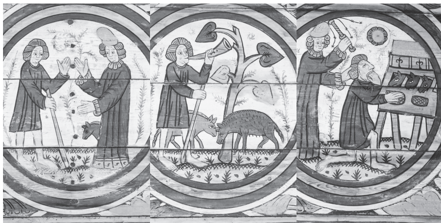
Figur 6. Legofolksinstitutionens tre faser, skildrade i en bildsvit av mästare Amund i Södra Råda kyrka i Värmland 1494. 1) Legodrängen (till vänster, barfota, barhuvad och klädd i billiga kläder) och husbonden inleder legostämman. 2) Legodrängen i arbete som svinaherde. 3) Legodrängen tvingas av svält stjäla korn av gödsvinen, straffas av husbonden med hård drag och gissel samt vräks därefter från hushållet.

om den tidigare husbonden godkände detta, och i övrigt bestraffades sedan mitten av 1300-talet att "locka" någon annans legofolk ur tjänsten, vilket sågs som ett brott mot den av Gud givna samhällsordningen. Spelet var med andra ord så konstruerat att arbetsrelationen mellan husbonde och legohjon endast skulle kunna avslutas när husbonden så önskade. Därför var också varje försök att avbryta arbetsrelationen i förtid belagt med hårda straff. I praktiken beivrades endast legorov och inte vräkningar, både för att husbönder hade mycket mindre anledning att kasta ut ett oönskat legohjon och för att legohjon i praktiken hade långt mer begränsade möjligheter att dra sina husbönder inför rätta. Husbönder stämde däremot ofta sina avvikna legohjon, antingen för att få dem tillbaka i arbete eller annars för att få ekonomisk ersättning för det avtalsbrott som legohjonet hade begått då det berövat husbonden sin arbetskraft. Därtill hade husbönder alltsedan 1400-talet haft laglig rätt att antingen själva eller annars med hjälp av kronans ämbetsmän hämta hem avvikna legohjon med våld om så krävdes. För legohjon som ville avsluta arbetsrelationen och bryta legostämman i förtid återstod därför