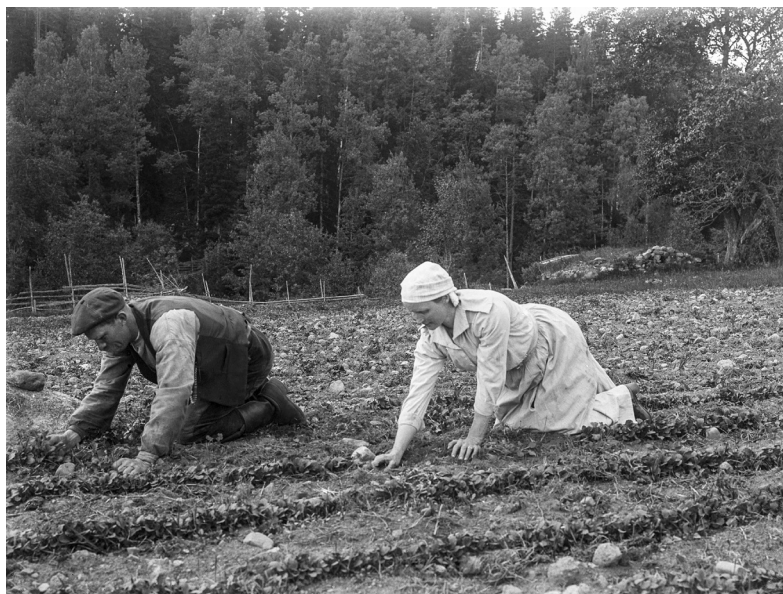
Män och kvinnor har ofta haft skilda arbetssfärer inom jordbruket, men i vissa sysslor gjordes ingen skillnad på kön. Rensning och gallring av rovor i Svinhults socken, Östergötland, 1920.

utomhus” 418 På små gårdar, där männen efter hand började med mycket utgårdarbete, fick kvinnorna ofta ta huvudansvaret även för traditionellt manliga sysslor i jordbruksarbetet. 419