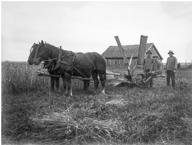
Skörd med självbindare i Ekby socken, 1928.

Uppdelningen i socknar med små respektive stora gårdar följer i stor utsträckning en indelning i Öst- och Västsverige. Det kan dock vara intressant att ställa ett renodlat öst/väst-mönster i relation till uppdelningen i små och stora socknar. I tabell 4.6 har därför de fyra socknarna Boglösa, Vårdsberg, Hackvad och Runtuna räknats som östsvenska och Ekby, Dannike, Furuby och Femsjö som västsvenska. Skånska Ullstorp och norrländska Undersvik har helt undantagits från jämförelsen. Samma skifte i mönstret framträder runt 1930, men proportionerna är något annorlunda. Å ena sidan är skillnaderna vid nedslagsåren 1890 och 1910, då syskonjordbruken var något vanligare i Östsverige, mindre. Från 1930, då de blev vanligare i Västsverige, är å andra sidan skillnaden mellan öst och väst betydligt större. Den stora ökningen mellan 1910 och 1930, då andelen syskonjordbruk närmast fördubblades, förefaller ha varit ett västsvenskt fenomen. Utvecklingen i Femsjö har stor inverkan på siffrorna, men räknas socknen bort hade ändå de västsvenska områdena en klart högre andel 1930.