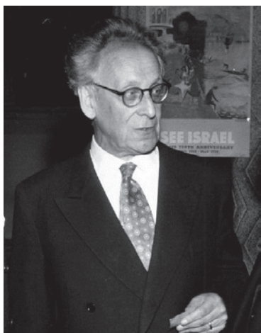
Hugo Valentin fotograferad av Svenska Dagbladet 1958.