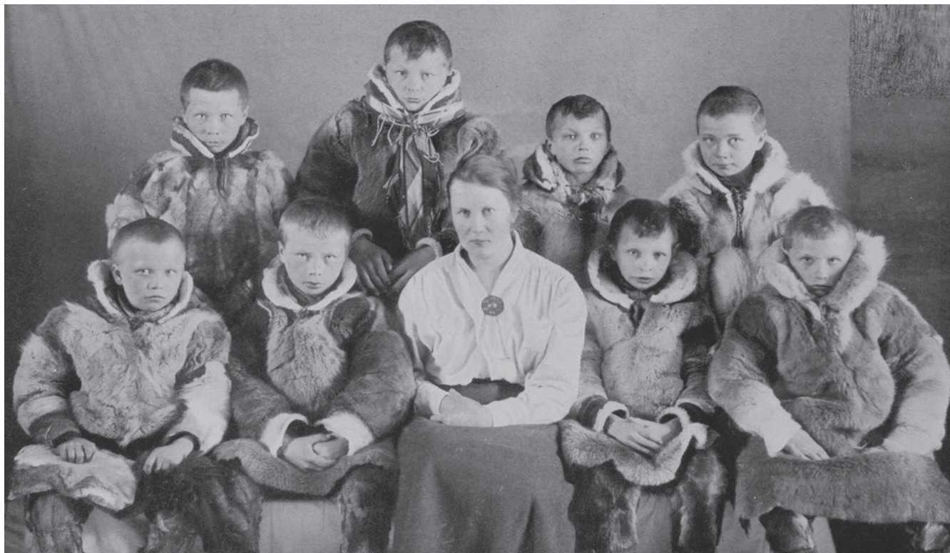
Samiska nomadskolebarn tillsammans med sin "nordiska" lärarinna, fotograferade av forskare från Rasbiologiska institutet. Ur The Race Biology of the Swedish Lapps: Part II 1941.