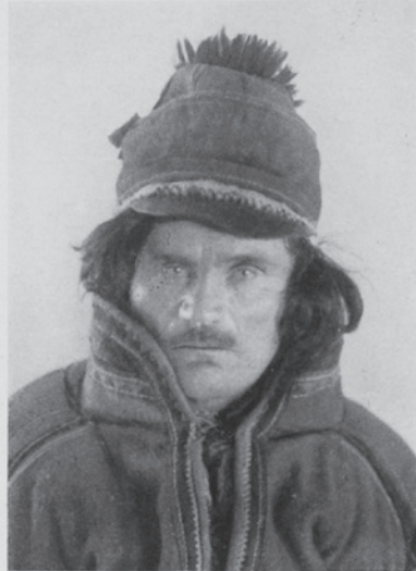
Ljusögd, eljest typisk lapp.