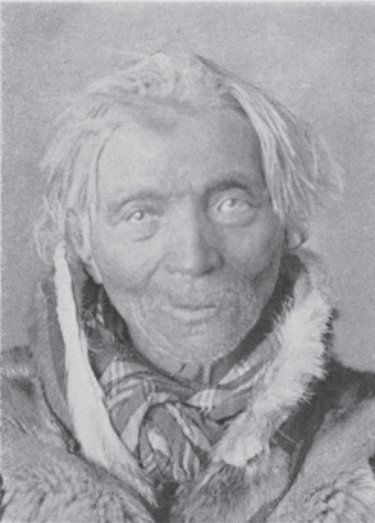
Gammal lappgubbe, starkt gråhårig (ovanligt).