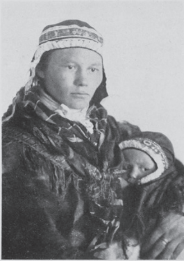
Typisk tornelapska med sitt barn vid bröstet.