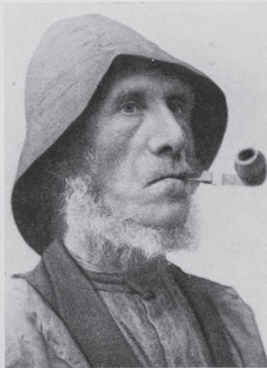
Fiskare från Hälsingland. Nordisk typ.