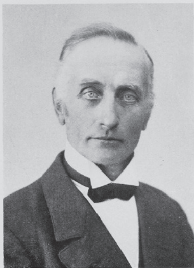
Jämtländsk hemmansägare. Nordisk typ.