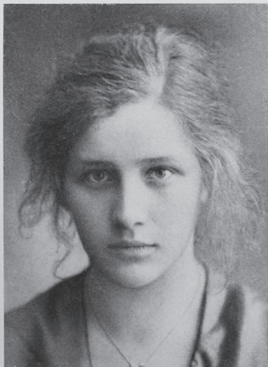
Bondflicka från Gästrikland. Nordisk typ.