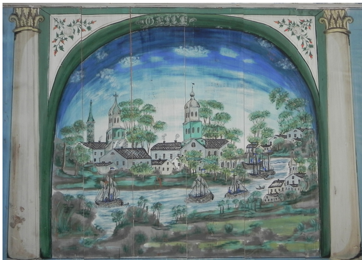
Figur 1 (2.6.1): Måleri från 1853 i sängstugan på Pallars, Långhed, Alfta.

Utöver inredningarna i Pallars finns ytterligare tre interiörer på ursprunglig plats i Alfta som har tillskrivits Blåmålararen. Ett målat rum i gården Bråna i Gundbo vilket är daterat 1859, en del av en interiör i Nygårds i Näsbyn från 1861 och en odaterad inredning i gården Hammar i Nordanå (LjM, Kerstin Sinhas arkiv). Utöver dessa finns ytter-