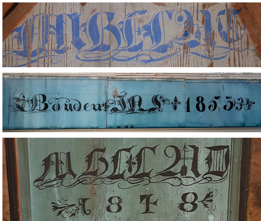
Figur 2 a–c (2.6.2 a–c): Jämförelser av målade typsnitt. Från Pallars i Alfta (ovan och mitten) och Bommars i Ljusdal (under).

Världsarvsgården Bommars, eller Oppigården som hemmanet Letsbo nr 2 kallades tidigare, har två mangårdsbyggnader. De är bägge uppförda åren 1846–1848 (LjM, Harald Grundells arkiv; Berg et al. 2002), efter att en brand den 9 maj 1845 hade lagt den tidigare bebyggelsen i aska (Ljusdal KI:6:180). En av byggnaderna har flera interiörer bevarade från mitten av 1800-talet och allt talar för att byggnaden inreddes i direkt anslutning till bygget, då det hölls ett bröllop i släkten kort därefter (Berg et al. 2002:48ff). En klädstuga på övervåningen, tapetserad med tidningsmakulatur, bör ha inretts något år senare då tidningarna är daterade 1840–1851. I en vardagsstuga på bottenvåningen, den så kallade Västgötastugan (Berg et al. 2002:58), är väggarna brädklädda och schablonmålade. Dateringen ”Mållat 1848” finns på en väggfast säng som tillhör denna ursprungsinredning. Stilen på dessa bokstäver och