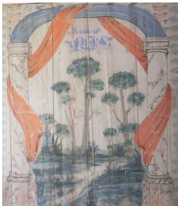
Figur 3 a–d (2.6.3 a–d): Inredningsfragment från Ol-Mårs i Sjöbo, Ljusdal 1846 (t.v.) samt detaljer från inredningarna i Pallars i Alfta 1853 (t.h.).

förd med samma uttryck som de i Bommars. I Ol-Mårs centralmotiv som föreställer ”Jakob brottas med Gud”, finns också en stor del av de kännetecken som återfinns i Blåmålares Alftainredningar (se fig. 3). 80