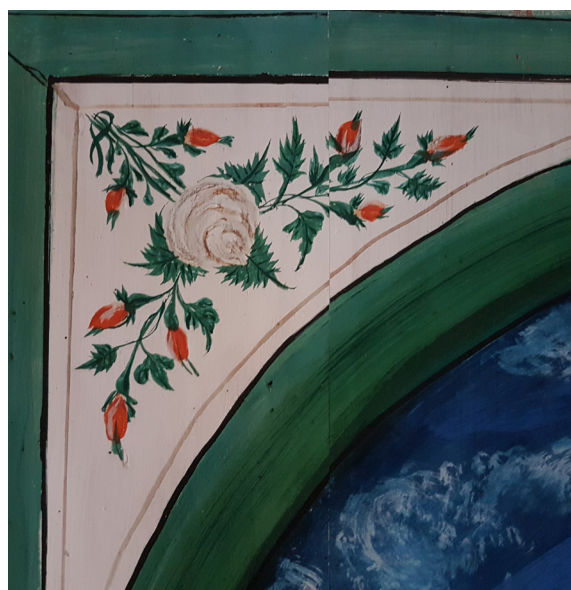
Figur 6 a–c (2.6.6 a–c): Låda från Ljusdal märkt "EOD" 1847, skrin från Delsbo märkt "ONS" 1850 samt blommor målade på vägg i Pallars 1853. Den större vita blommen i mitten av ornamentet i Pallars har förlorat sin färg genom blekning. Färgämnet har möjligen ursprungligen varit rött. Bokstäver och siffror kan även jämföras med de i Bommars och Pallars i figurerna 2 och 3.