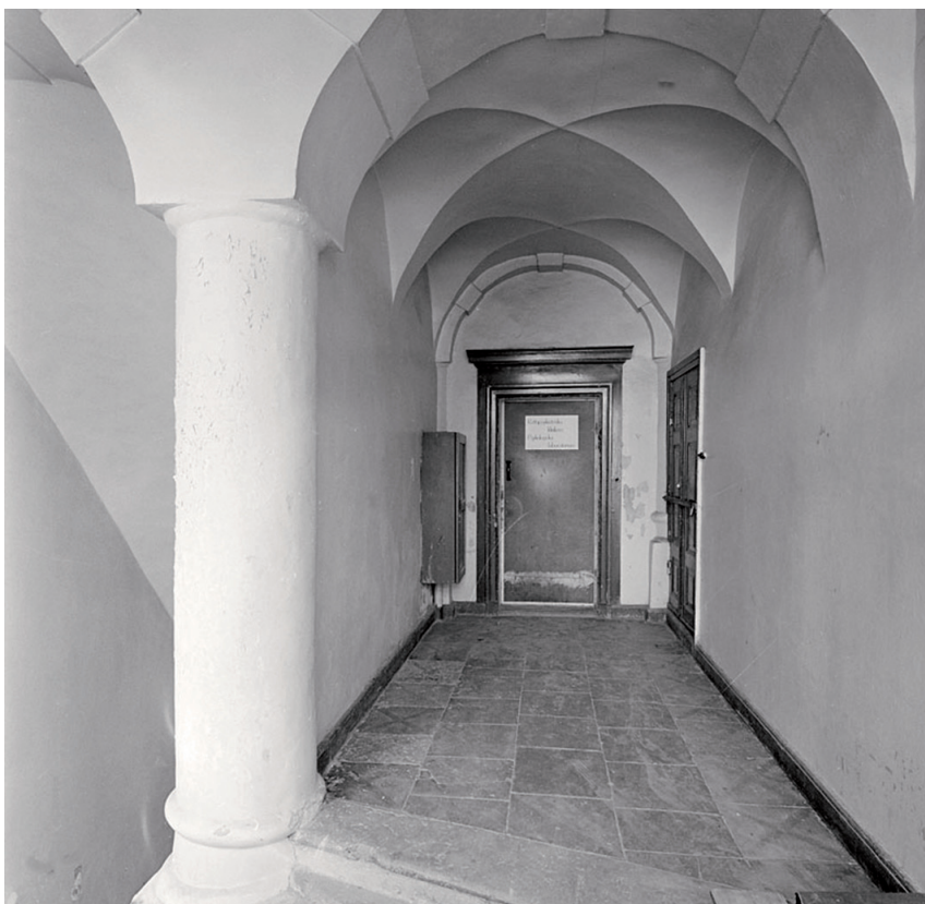
Långholmens centralfängelse, Alstavik. Foto: Stockholms stadsarkiv. Fotograf: Lennart af Petersens, 1967.

begåvade och förslagna kriminalpatienter, samtidigt som han kunde vara känslokall och tyrannisk mot mindre begåvade. 36 Den påminner också om Kinbergs dröm om ett "kriminalhospital" där alla typer av brottslingar kunde vårdas samtidigt, men noggrant åtskilda på basis av vilken störning de led av. 37