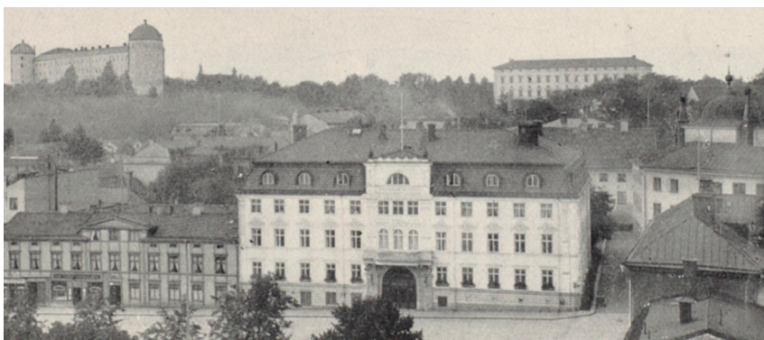
Hotell Gillet vid Fyrstorg i Uppsala runt 1920.

sig kunna sluta sig till den utlösande orsaken, eller, som han själv uttryckte det, rekonstruera paranoians psykogenetiska uppkomst: