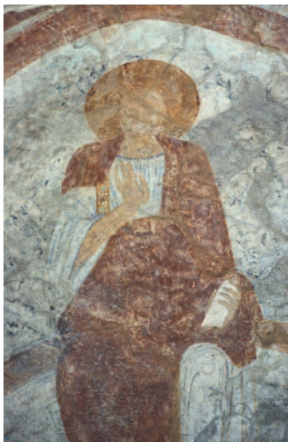
Fig. 9. Sønder Jernløse Kirke, 1125. Majestas med ortodox velsignelse.

Det er blevet påvist, at det officielle skisma først og fremmest berørte forholdet mellem Rom og Konstantinopel og først langsomt trængte igennem i yderområderne, f. eks. kunne man gifte sig i kongelige sammenhænge på tværs af trosretningerne, som Ingeborg og Knud Lavard gjorde c. 1117. 91 I øst kunne skandinaver der fulgte den latinske ritus endog øve indflydelse på tidlige kristne ritualer som disse voksede frem i 1000-tal-