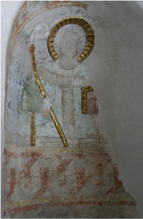
Fig. 14. Måløv Kirke, o. 1130. Sankt Nikolaus.

modelleret i stuk og forgyldt, fig. 14. Også bispens hånd er modelleret og bemalet med hudfarve. I den anden hånd holder han en bog foran brystet. Biskoppens hoved er uden mitra.