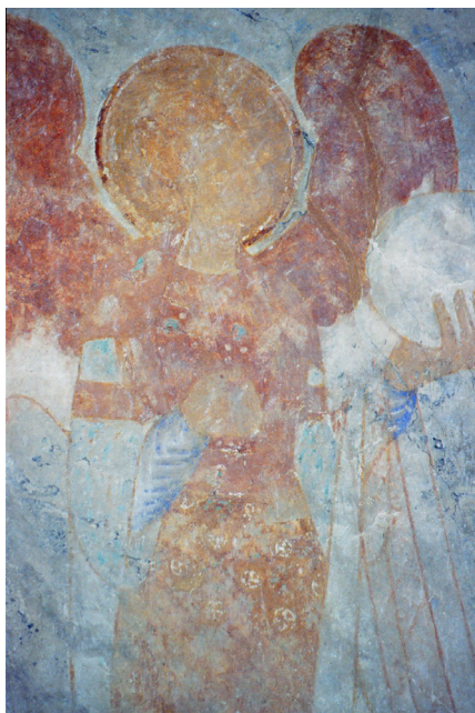
Fig. 10. Søndre Jernløse Kirke, 1125. Ærkeengel.

let i et af de vigtigste ortodokse centre i Rus', Huleklosteret i Kiev. 92 Desuden ser vi i 1100-tallet, hvorledes skandinaviske og, gennem dansk formidling, angelsaksiske helgener finder optagelse i en russisk bøn. 93 Fra vort eget område har vi Adam af Bremens kritiske beskrivelse af Ærkebisp Adalbert (1043-72), der på et tidspunkt ikke ville følge latinsk ritus ( more ) men erstattede den med en anden romersk eller græsk tradition. 94