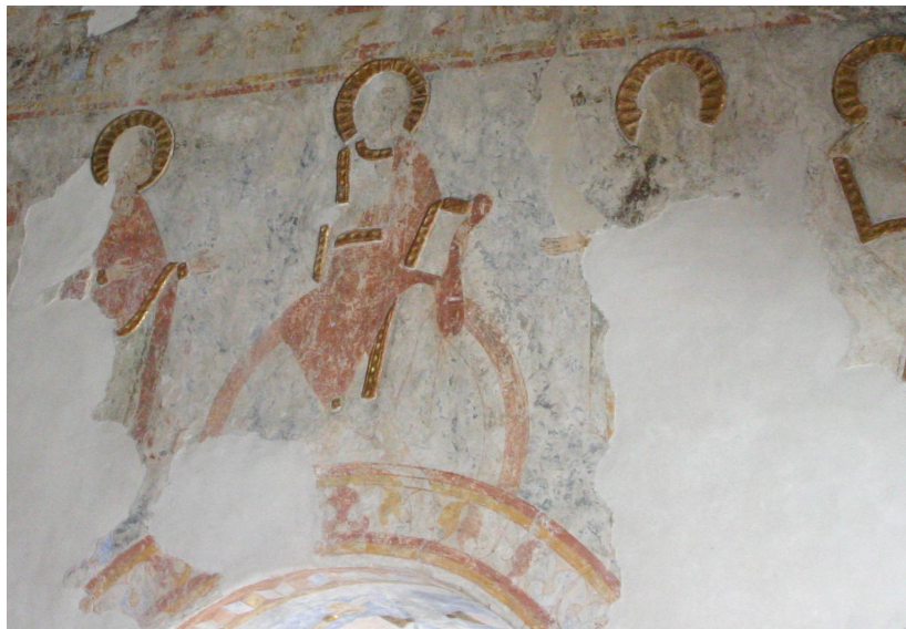
Fig. 12. Måløv Kirke, o. 1130. Triumfvæggens Deesis.

Måløv Kirke har på triumfvæggen yderligere to andagtsbilleder. Det nordlige opdagedes, da man i 1929 nedtog tilmuringen af sidealternichen. Frem kom i al sin pragt en halvfigurs Madonna med barnet, fig. 13. Motivet havde aldrig været overkalket, og derfor var farvehold-