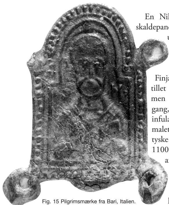
Fig. 15 Pilgrimsmærke fra Bari, Italien. Sankt Nikolaus.

En Nikolaus fremstilling med høj skaldepande uden mitra er måske også udtryk for byzantinsk påvirkning. I flere tidlige ærkebispefremstillinger i korbuer både i Jørlundeværkstedet og i Finjaværkstedet er bisperne fremskiltet med bispestav og pallium, men uden mitra. Første og eneste gang, man ser en relief mitra med infula, er i Herstedøster Kirke, også malet af Jørlundeværkstedet. I det tyske materiale fra første halvdel af 1100-tallet findes flere kalkmalerier af ærkebisper med mitra, for eksempel i Prüfeningen nær Regensburg, 1119. Derfor må skaldepanden i de sjællandsk-skånske kalkmalerier udtrykke et bevidst valg, inspi-