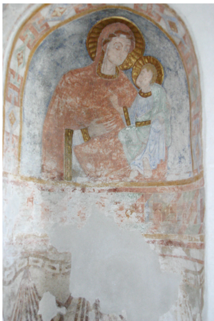
Fig. 13. Måløv Kirke, o. 1130. Madonna Hodegetria.

ningen og detaljerne meget velbevarede. Jomfru Maria holder Jesusbarnet på sin venstre arm. Han er iklædt hvid dragt med grøn kappe, og det ser ud til, at han i venstre hånd har holdt en bogrulle. Med den højre velsigner han mod moderen. Marias højre hånd peger mod det guddommelige barn, det er en såkaldt Madonna Hodegetria.