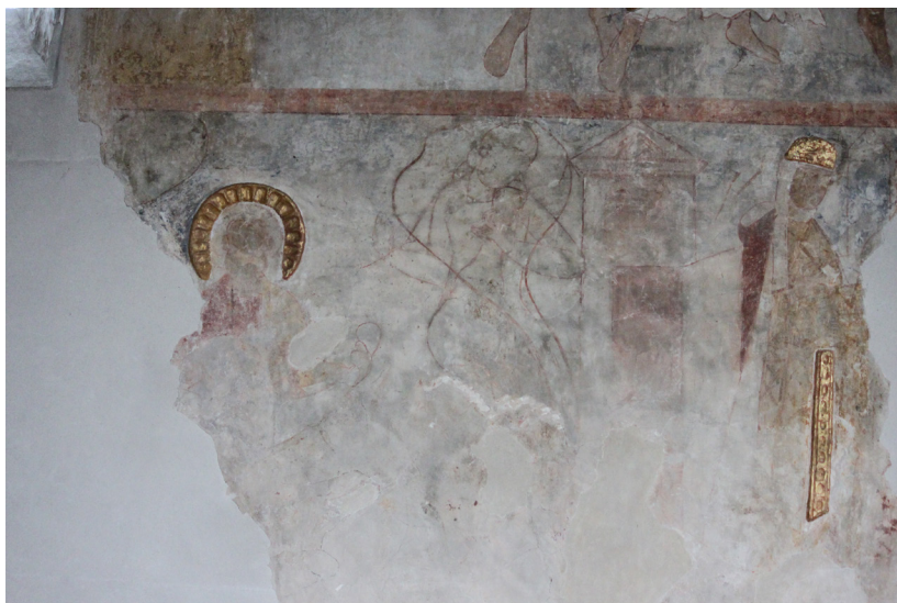
Fig. 16. Måløv Kirke, o. 1130. Abraham med sjæle, Paradissymbol. Salig stifterinde.