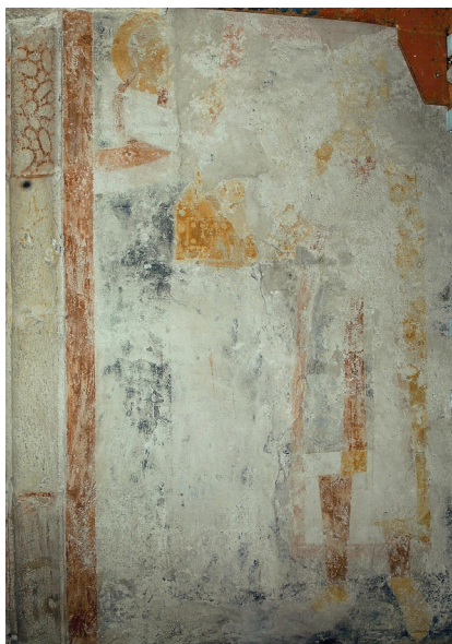
Fig. 3 Vå Kirke, 1121. Kong Niels med relikvieskrin.

var jomfru, da hun blev gift med kong Niels, men at hun først fik børn i ægteskabet med den danske konge. 17 Saxo præsenterer hende også som en meget gudfrygtig kvinde, der var en stor velgører mod kirker. Hun bidrog til udsmykning af disse og til højnelse af det ellers ringe niveau, som de liturgiske dragter i Danmark havde, og hun drog omsorg for, at der blev fremstillet pragtfulde messeklæder og ”pallier”. 18