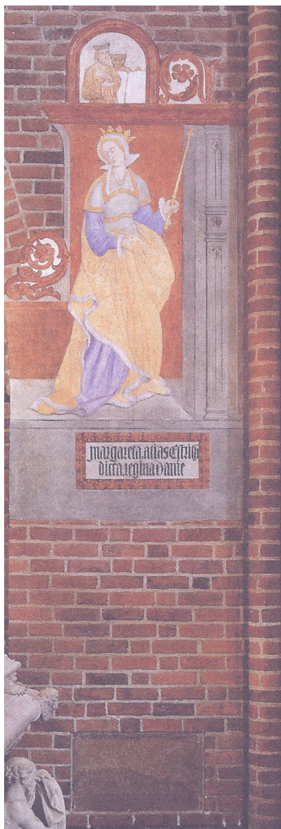
Fig. 7. Roskilde Domkirke, pillegrav i koret. Kalkmaleri 1500-tallet.

"Til den fromme Margrete, Danmarks fyrstinde, et digt i glykoniske og asklepiadeiske vers. – Den mægtige svenske kong Inge avlede den hulde Estrid, hende gav han også den danske konge til ægtefælle. Hun fødte de gottensiske til de skånske landområder. Hun smykkede gudshusene, hvilke hun gavnede med forskellige