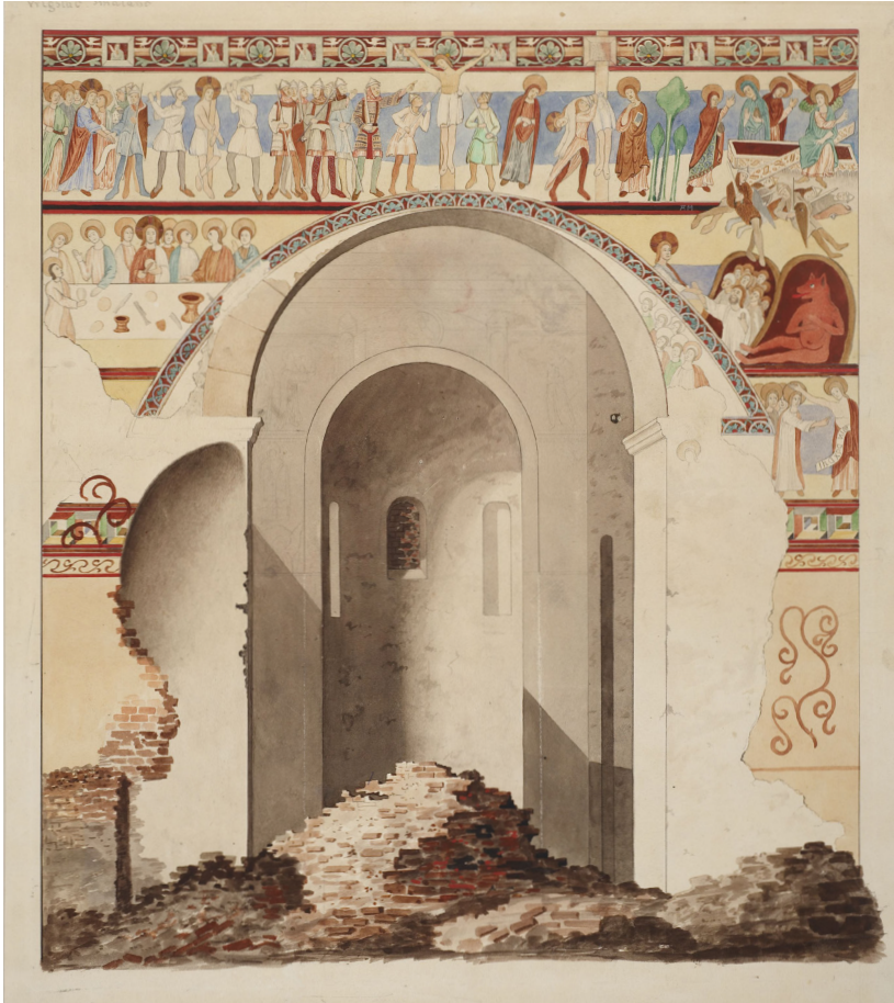
Fig. 11. Vrigstad Kirke, Småland. Akvarel af freskerne i den 1865 nedrevne kirke.

var også meget velbevarede og havde alle de stærke farver i behold. Ornamentikken havde i kronfrisen den karakteristiske blandingsfrise med planteornamentik, afbrudt af felter med ikoner af hellige samt nogle karakteristiske hvide fugle, fig. 11. Denne ornamentfrise er tilstrækkelig til at placere Linköpingbiskopen Gisles fine egenkirke i Jørlundeværkstedet. Gisle havde tætte forbindelser til ærkebiskop Eskil og deltog i dennes synode i Lund 1139.