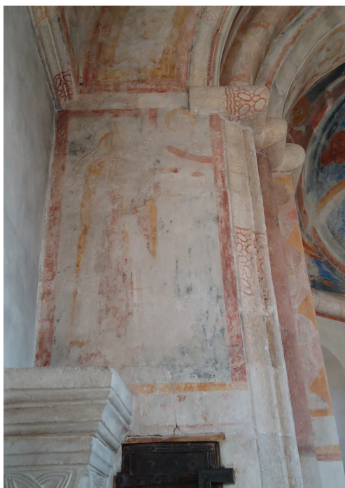
Fig. 2. Vä Kirke, 1121. Dronning Margrete Fredkulla med kirkemodellen.

blevet barnløst. Hun var med andre ord stadig en meget rig kvinde. 11 I Danmark fødte hun mindst to sønner. Den ældste, Inge, opkaldt efter sin morfar, døde som barn. 12 Den næste søn, Magnus, opkaldt efter sin farfar, Svend (Magnus) Estridsen, blev ifølge Saxo i 1120'erne tilbudt kongeværdigheden over göterne, da den svenske kong Inge den Yngre, dronning Margretes fætter, døde, 13 og Magnus gennem sin mor kunne rejse et arvekrav. Desuden var det her dronning Margrete både i egen ret og som medgift havde besiddelser. Fig. 1 og 2.