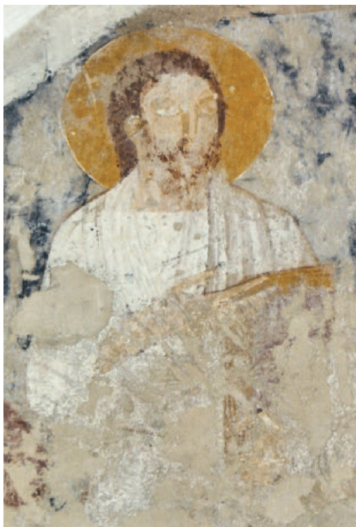
Fig. 5. Gundsømagle Kirke, o. 1100. Apostlen Paulus.

I korets mur fandt man et stykke forstærkningstømmer, som dendrokronologisk kan dateres til omkring 1100. Dermed ved vi nu, at den hidtil ældste, kendte udsmykning på Sjælland er tidlig. Ja så tidlig, at malerierne sandsynligvis afspejler den tabte udsmykning i den tidligere frådstens Domkirke i Roskilde, forgænger for den nuværende domkirke fra det 13. århundrede. 48 I Danmark er stort set ingen af de oprindelige udsmykninger af domkirkerne bevaret, de fleste tidlige kalkmalerier findes alene i sognekirker.