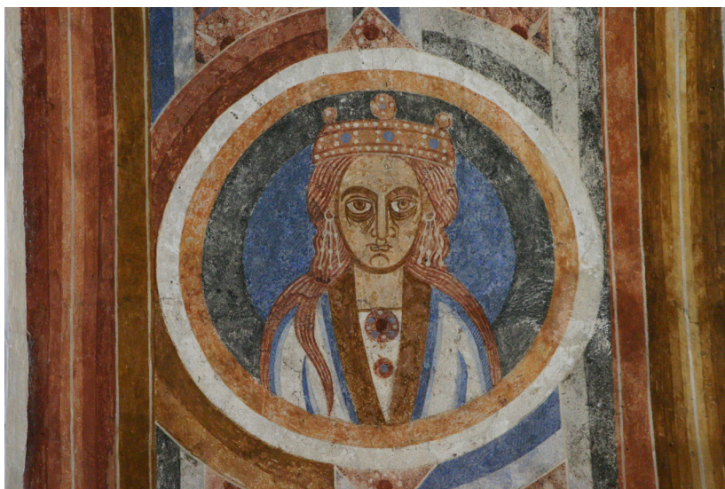
Fig. 6. Sæby Kirke, o. 1125. Dyden Caritas med byzantinske øreringe.

På korets nordvæg er nogle apostelfigurer synlige, delvist dækket af det senere hvælv. Deres kunstneriske kvalitet er uskadet, da de er afdækket efter de nyeste konserveringsmetoder. I korbuen er der en hårdt restaureret udsmykning med tre medaljoner i et system af prismestave på en mønstret bund. 51 Der er muligvis tale om tre halvfigurer af dyder med glories, dog uden de indskrifter, vi finder i Sæby Kirkes korbue, fig. 6.