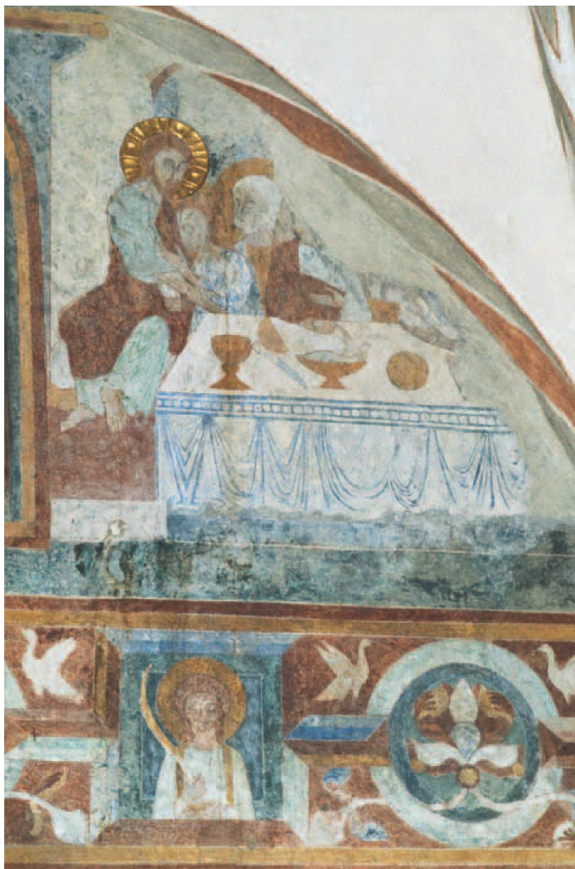
Fig. 18. Jorlunde Kirke, Sjælland. O. 1140. Nadveren og lavfrise, se fig. 11.