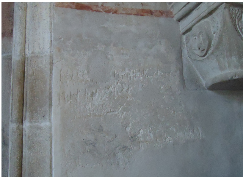
Fig. 8. Vä Kirke, 1122. Runeindskrift ridset i fugtig puds.

fordelte ligeligt med én til sig selv og de øvrige til de ægtepar jeg netop har nævnt”. 82