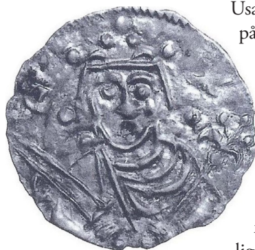
Fig. 4 Mønt slået af Kong Niels i Lund.

”Men da Niels ikke havde så meget forsynlighed og styreevne, som rigets tarv krævede, beroede styrelsen for største delen på den ædle dronning Margrete, så at fremmede sagde, at Danmarks styrelse lå i kvindehånd”. 14